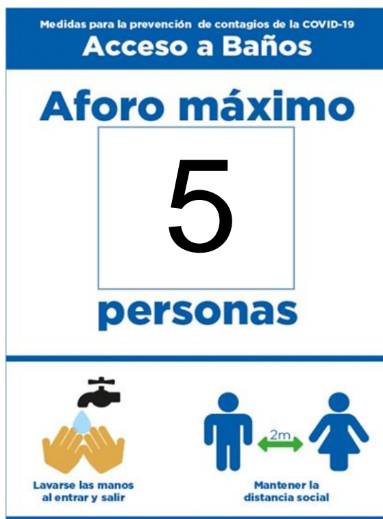
Señalética indicando aforo máximo permitido